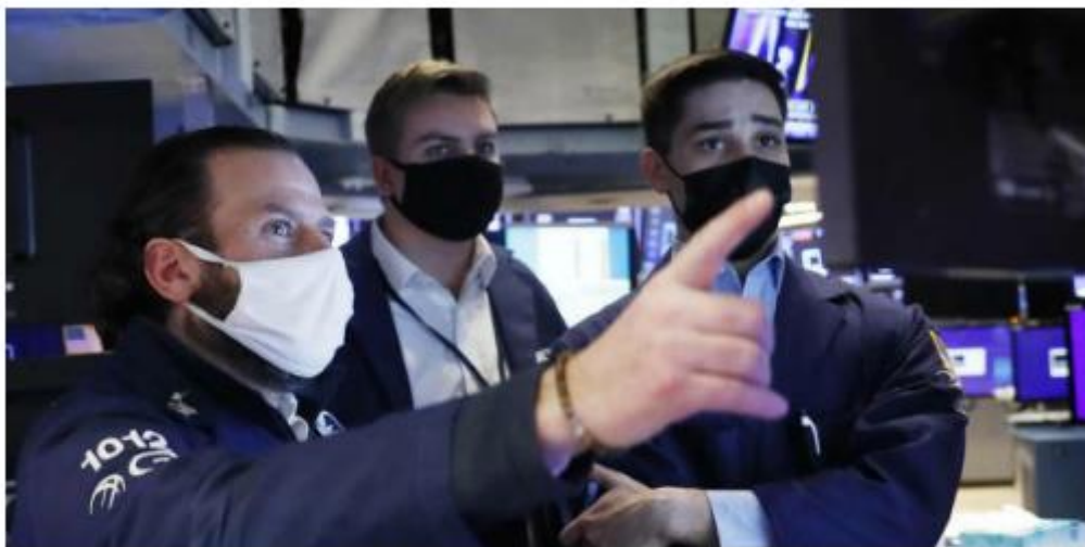
Trader an der New Yorker Wall Street. Eine sorgfältige Aktienauswahl ist entscheidend, damit das Portfolio in Zeiten steigender Preise nicht an Wert verliert.

Anlagen in Aktien gelten als gutes Mittel, um Vermögen bei anziehender Teuerung vor dem drohenden Wertverlust zu bewahren. Aber haben sie diesen Ruf auch zu Recht? Kurz gesagt: Zum Teil. Worauf es ankommt, damit ein Papier das Ersparte vor Inflation schützt, erläutern Experten aus der Investmentbranche.