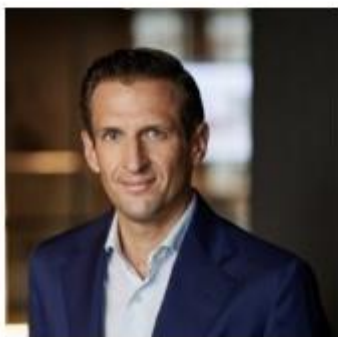
Dominicus Wagner © Wagner & Florack

Es heißt, Aktien schützen vor Inflation – und in der Theorie macht das auch Sinn: Steigende Preise führen bei den Unternehmen zu höheren Umsätzen. Bei unveränderten Margen steigt der Gewinn, was sich für die Anteilseigner:innen wiederum in Form höherer Dividenden und Aktienkurse auszahlt. Das Problem: Grau ist alle Theorie.